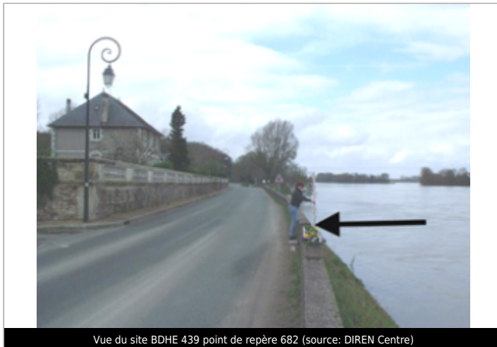
Vue du site BDHE 439 point de repère 682