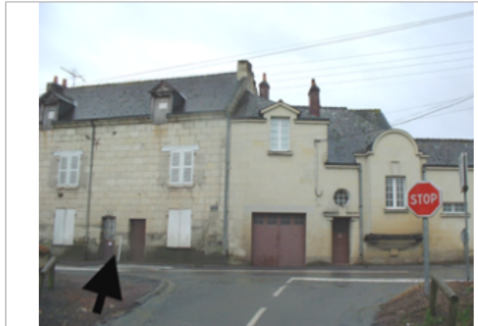
Vue du site BDHE 435 point de repère 678

Coordonnées WGS84 : X: -0.02736180 / Y: 47.24410620