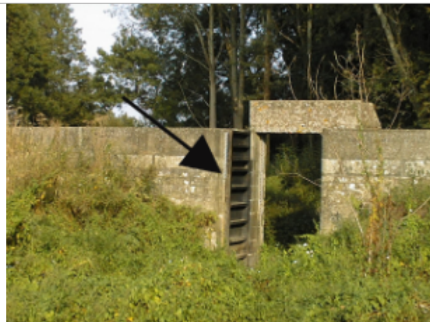
Vue du site BDHE 393 point de repère 575