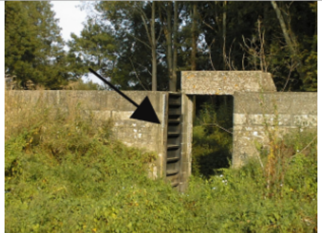
Vue du site BDHE 393 point de repère 575

Coordonnées WGS84 : X: -0.48955432 / Y: 47.41306270