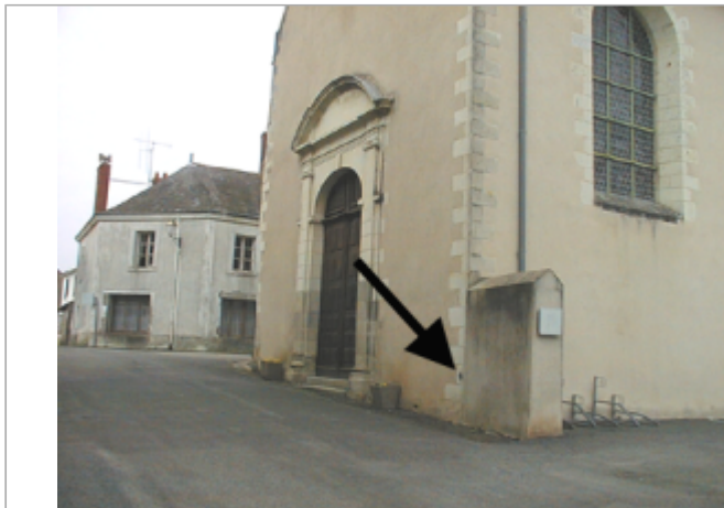
Vue du site BDHE 374 point de repère 697

Coordonnées WGS84 : X: -0.96229560 / Y: 47.37972600