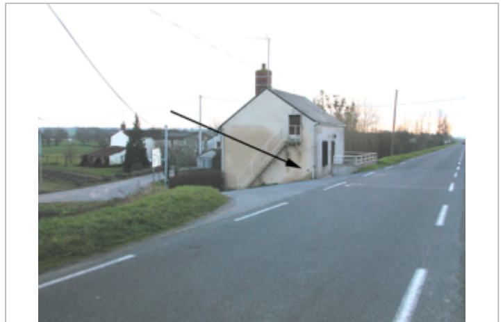
Vue du site BDHE 372 point de repère 530

Coordonnées WGS84 : X: -0.92976500 / Y: 47.39249420