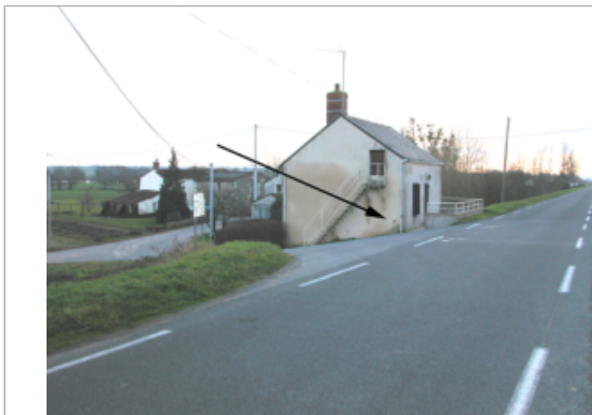
Vue du site BDHE 372 point de repère 530 (source: DIREN Centre)

Coordonnées WGS84 : X: -0.92976500 / Y: 47.39249420