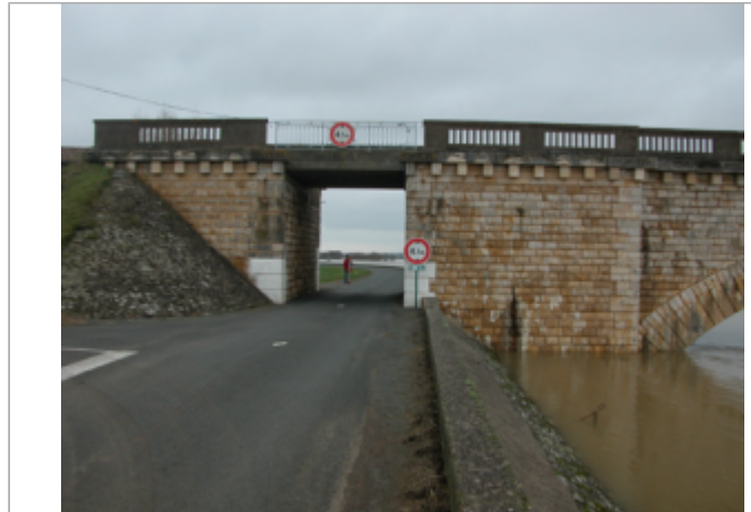
Vue du site BDHE 353 point de repère 493

Coordonnées WGS84 : X: -0.71947660 / Y: 47.36355670