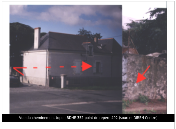
Vue du cheminement topo : BDHE 352 point de repère 492