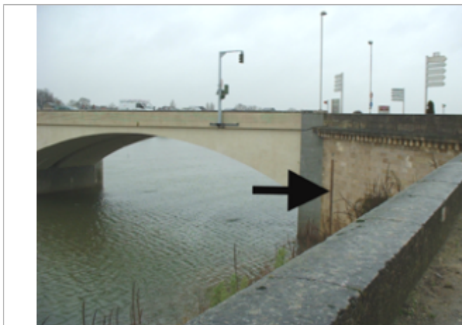
Vue du site BDHE 342 point de repère 457

Coordonnées WGS84 : X: -0.06990730 / Y: 47.26700610