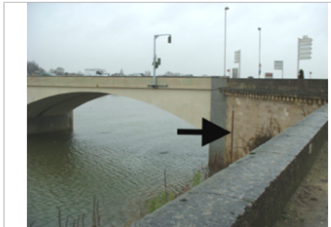
Vue du site BDHE 342 point de repère 457

Coordonnées WGS84 : X: -0.06990730 / Y: 47.26700610