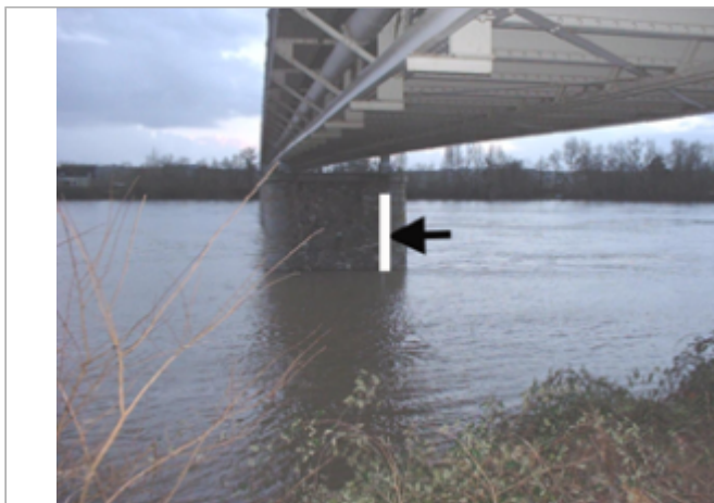
Vue du site BDHE 341 point de repère 451

Coordonnées WGS84 : X: -0.64992100 / Y: 47.37485640