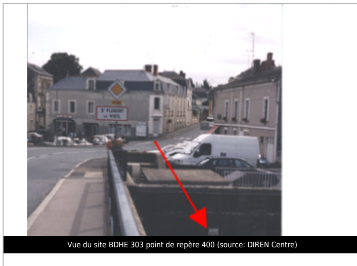
Vue du site BDHE 303 point de repère 400