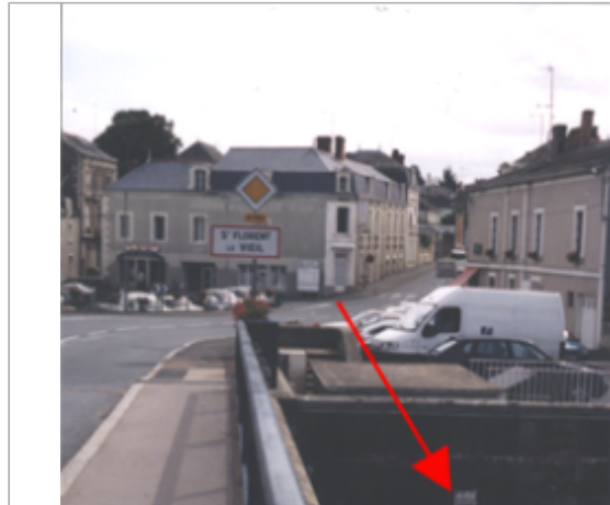
Vue du site BDHE 303 point de repère 400

Coordonnées WGS84 : X: -1.01440050 / Y: 47.36438910