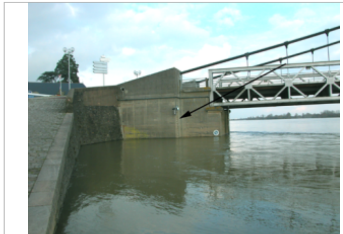
Vue du site BDHE 293 point de repère 447

Coordonnées WGS84 : X: -1.17731570 / Y: 47.36341990