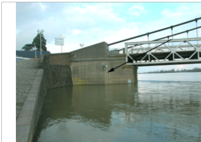
Vue du site BDHE 293 point de repère 447

Coordonnées WGS84 : X: -1.17731570 / Y: 47.36341990