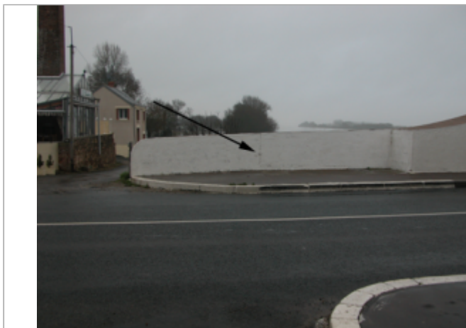
Vue du site BDHE 291 point de repère 647

Coordonnées WGS84 : X: -1.01667840 / Y: 47.37124200