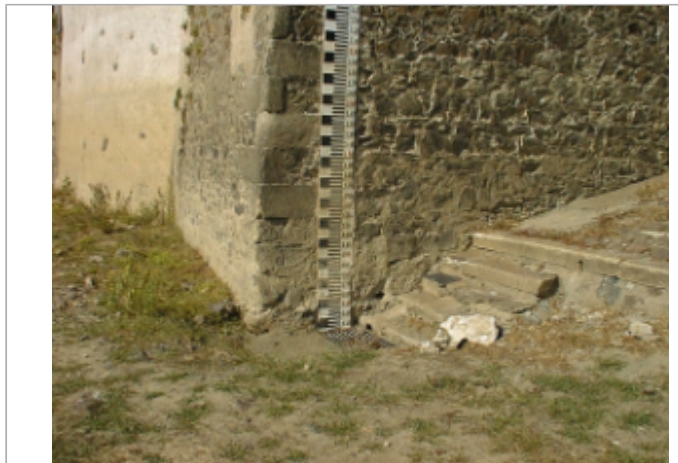
Vue du site BDHE 289 point de repère 359