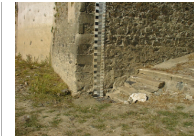
Vue du site BDHE 289 point de repère 359