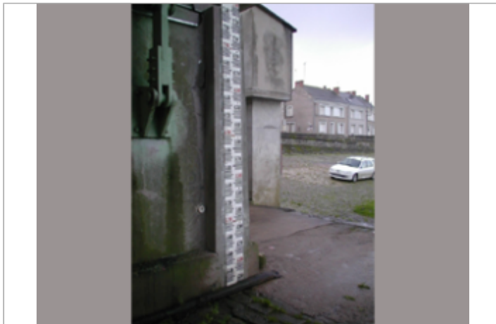
Vue du site BDHE 288 point de repère 358

Coordonnées WGS84 : X: -0.86111720 / Y: 47.39229010