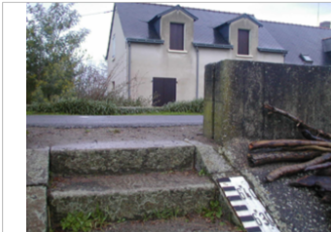
Vue du site BDHE 287 point de repère 357

Coordonnées WGS84 : X: -0.80395120 / Y: 47.38309040