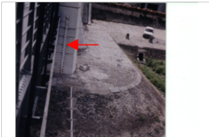
Vue du site BDHE 285 point de repère 389