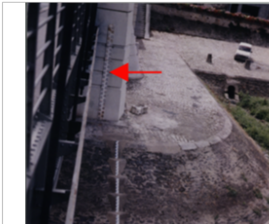
Vue du site BDHE 285 point de repère 389

Coordonnées WGS84 : X: -0.76230860 / Y: 47.35375030