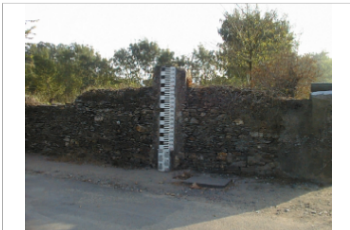
Vue du site BDHE 282 point de repère 353