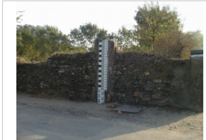
Vue du site BDHE 282 point de repère 353

Coordonnées WGS84 : X: -0.68410730 / Y: 47.37097440