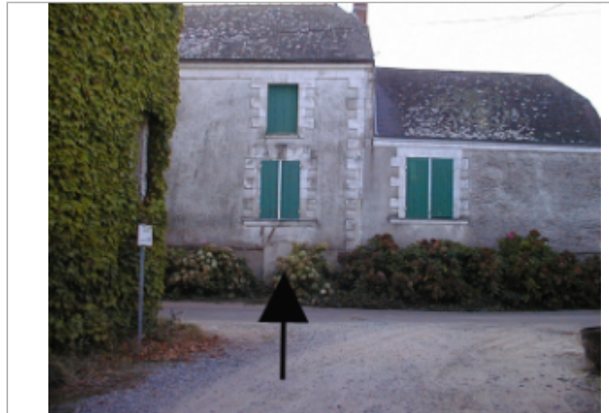
Vue du site BDHE 281 point de repère 351

Coordonnées WGS84 : X: -0.64259900 / Y: 47.37604150