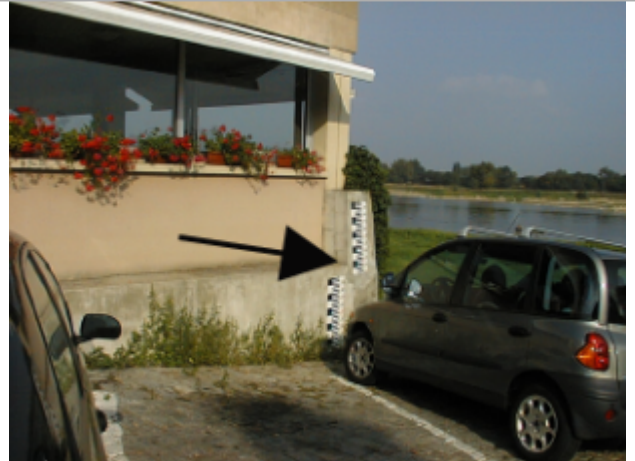
Vue du site BDHE 280 point de repère 350