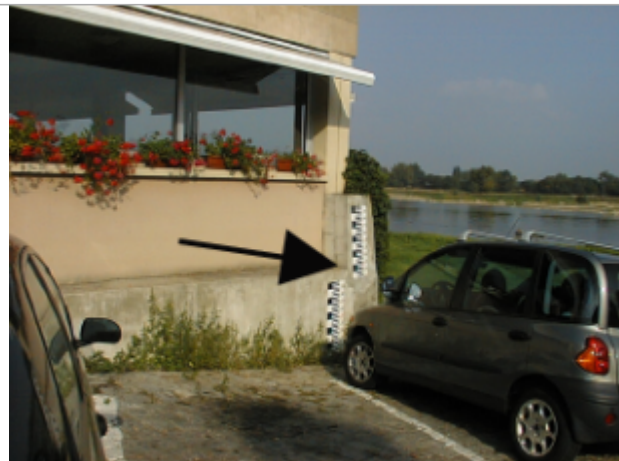
Vue du site BDHE 280 point de repère 350