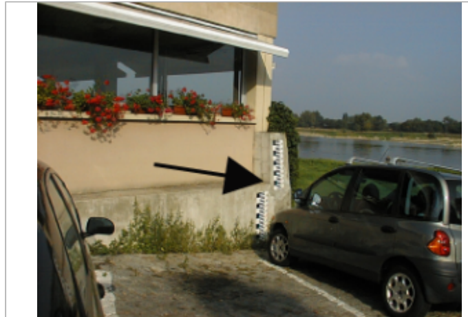
Vue du site BDHE 280 point de repère 350 (source: DIREN Centre)

Coordonnées WGS84 : X: -0.61781576 / Y: 47.40878690