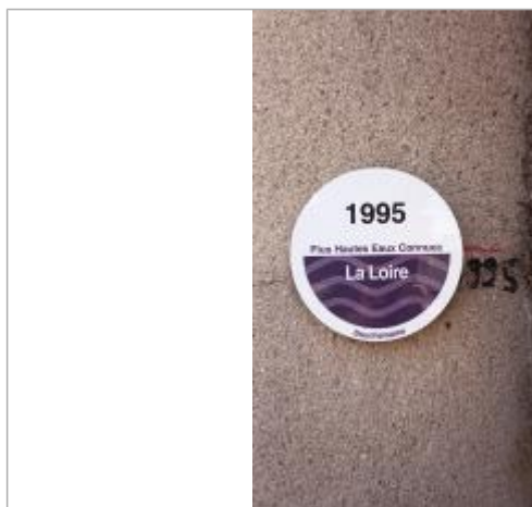
2025_Vue du repère 1995

SOURCE DE REPÉRAGE : VERSEMENT BDHE DREAL CVL - LOIRE MOYENNE PARTIE 6 (SECTEUR MAINE-LOIRE AVAL) - 20/11/2023