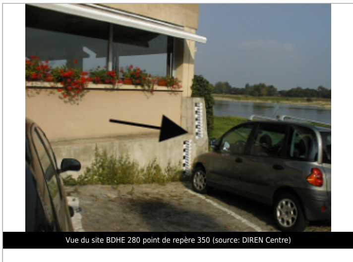
Vue du site BDHE 280 point de repère 350 (source: DIREN Centre)