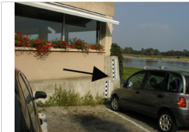
Vue du site BDHE 280 point de repère 350

Coordonnées WGS84 : X: -0.61781576 / Y: 47.40878690