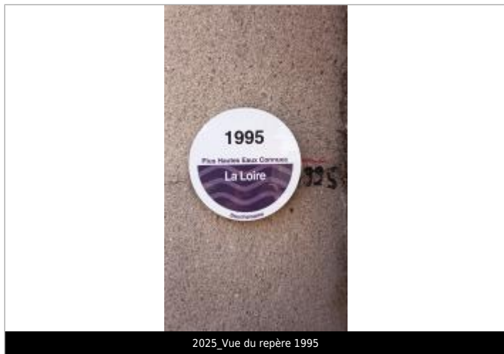
2025_Vue du repère 1995

Code : 23BDHELM6_R_31_5 Date de mise à jour : 26/11/2025 Auteur : msemery