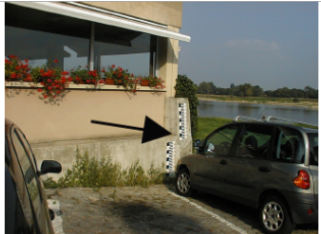
Vue du site BDHE 280 point de repère 350