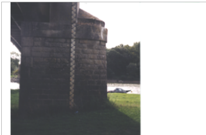
Vue du site BDHE 279 point de repère 347