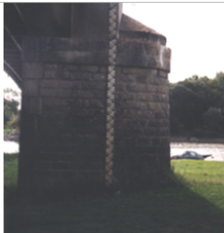
Vue du site BDHE 279 point de repère 347