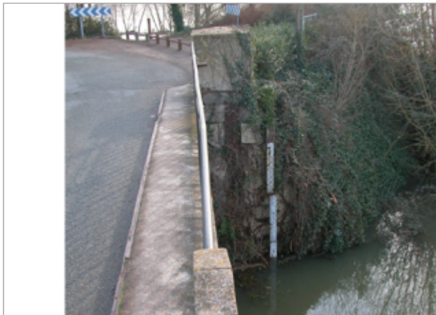
Vue du site BDHE 277 point de repère 345