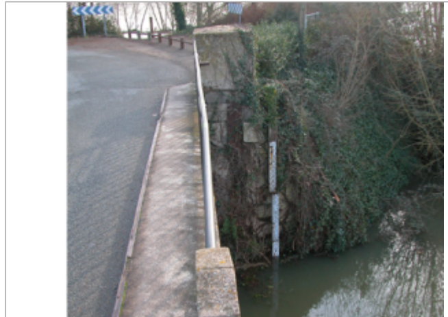
Vue du site BDHE 277 point de repère 345