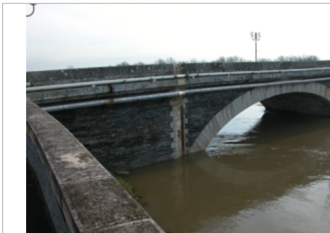
Vue du site BDHE 275 point de repère 342

Coordonnées WGS84 : X: -0.52704720 / Y: 47.42719420