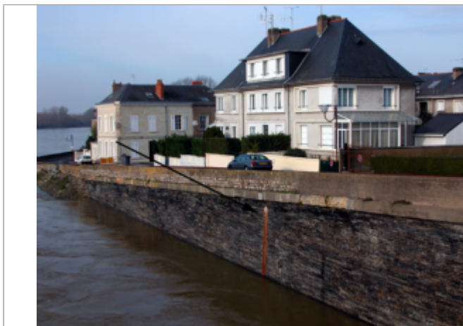
Vue du site BDHE 274 point de repère 786