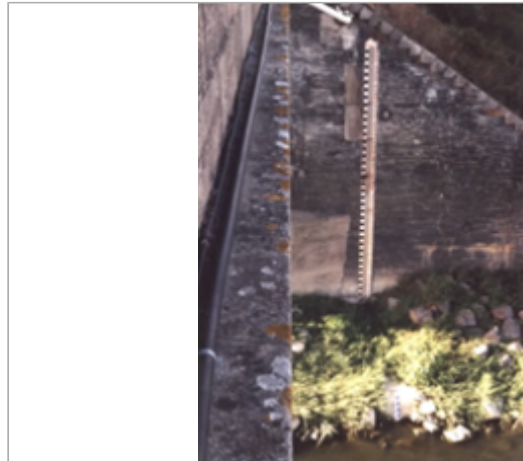
Vue du site BDHE 273 point de repère 341

Coordonnées WGS84 : X: -0.52330930 / Y: 47.41982850