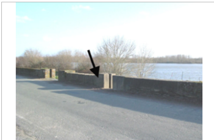
Vue du site BDHE 272 point de repère 391