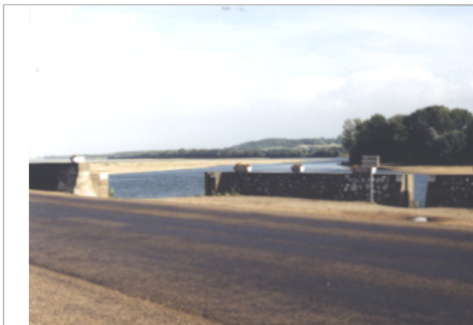
Vue du site BDHE 269 point de repère 337