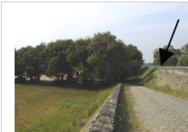
Vue du site BDHE 267 point de repère 336

Coordonnées WGS84 : X: -0.35233580 / Y: 47.41442290