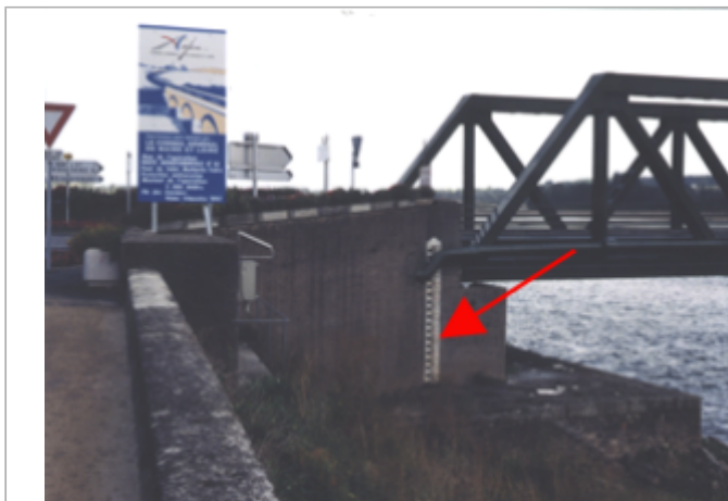
Vue du site BDHE 266 point de repère 334