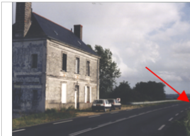
Vue du site BDHE 264 point de repère 333

Coordonnées WGS84 : X: -0.27241230 / Y: 47.38982390