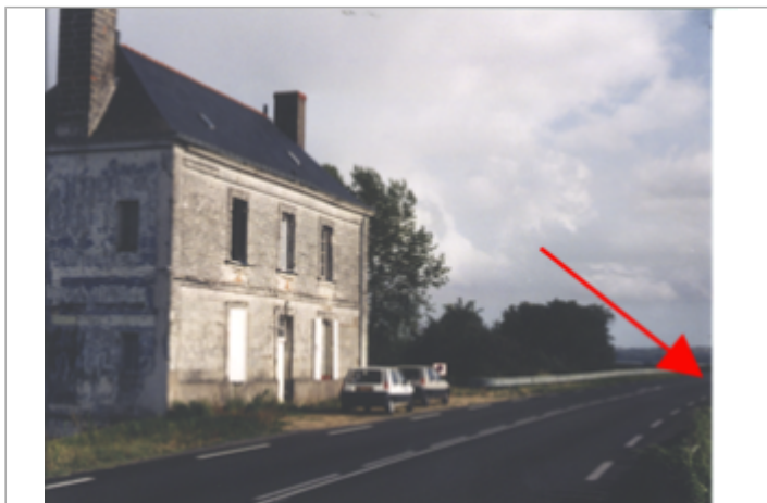
Vue du site BDHE 264 point de repère 333