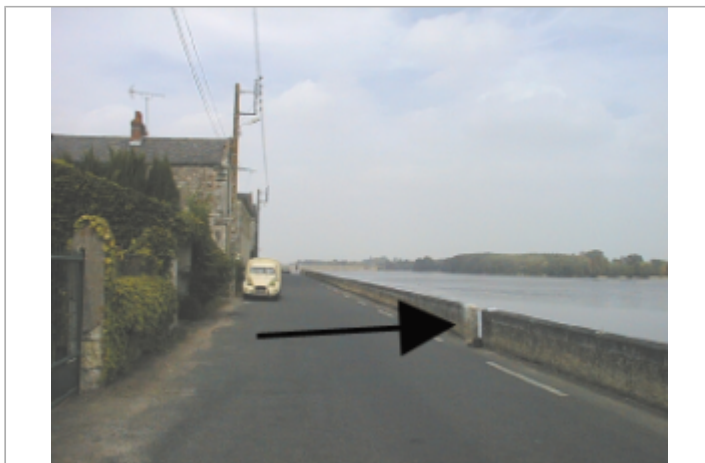
Vue du site BDHE 263 point de repère 332