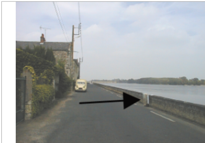
Vue du site BDHE 263 point de repère 332