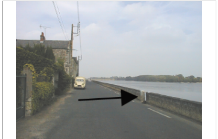
Vue du site BDHE 263 point de repère 332