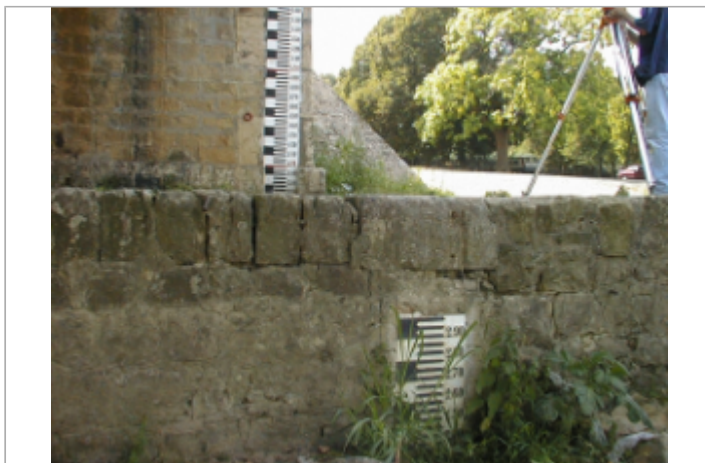
Vue du site BDHE 262 point de repère 331