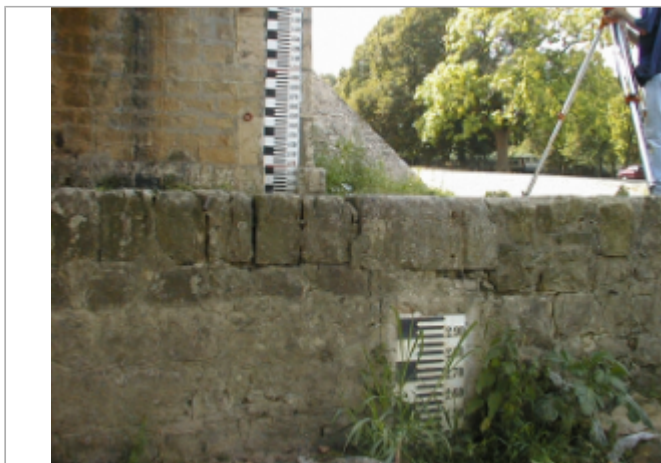
Vue du site BDHE 262 point de repère 331

Coordonnées WGS84 : X: -0.23098360 / Y: 47.34500680