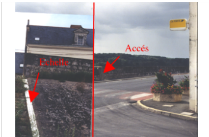
Vue du site BDHE 260 point de repère 328