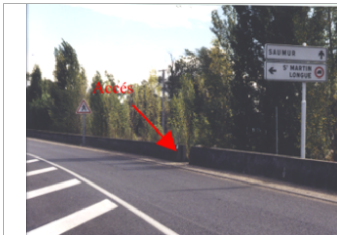
Vue du site BDHE 259 point de repère 327

Coordonnées WGS84 : X: -0.15225560 / Y: 47.31496190