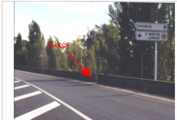
Vue du site BDHE 259 point de repère 327

Coordonnées WGS84 : X: -0.15225560 / Y: 47.31496190